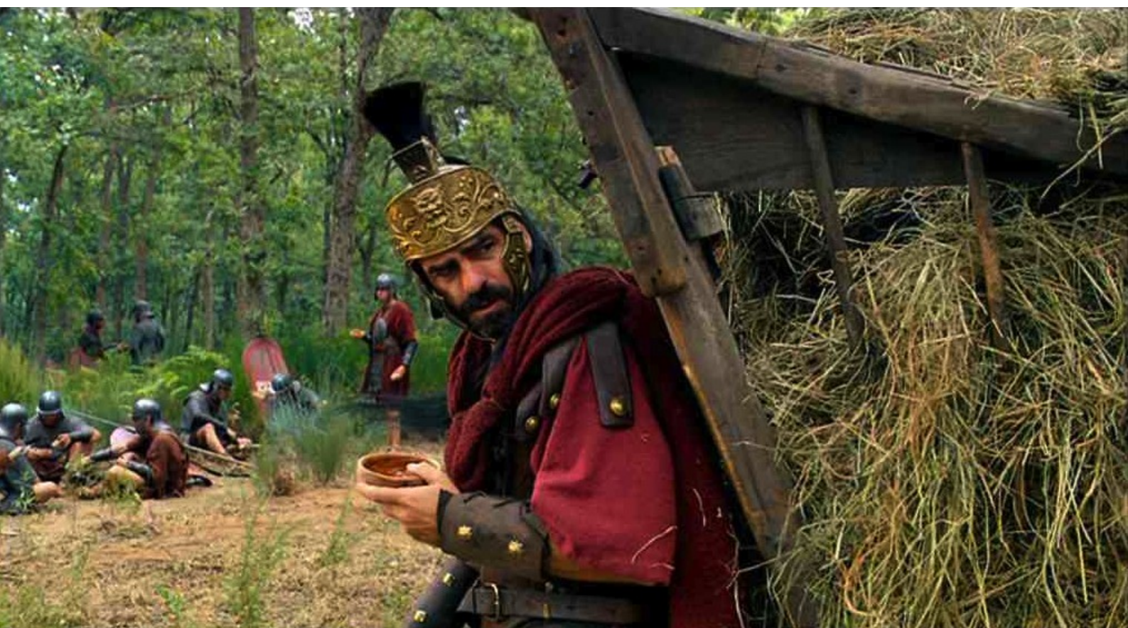
Hispania, la Leyenda : et de leur chef Décimo León Moreno,