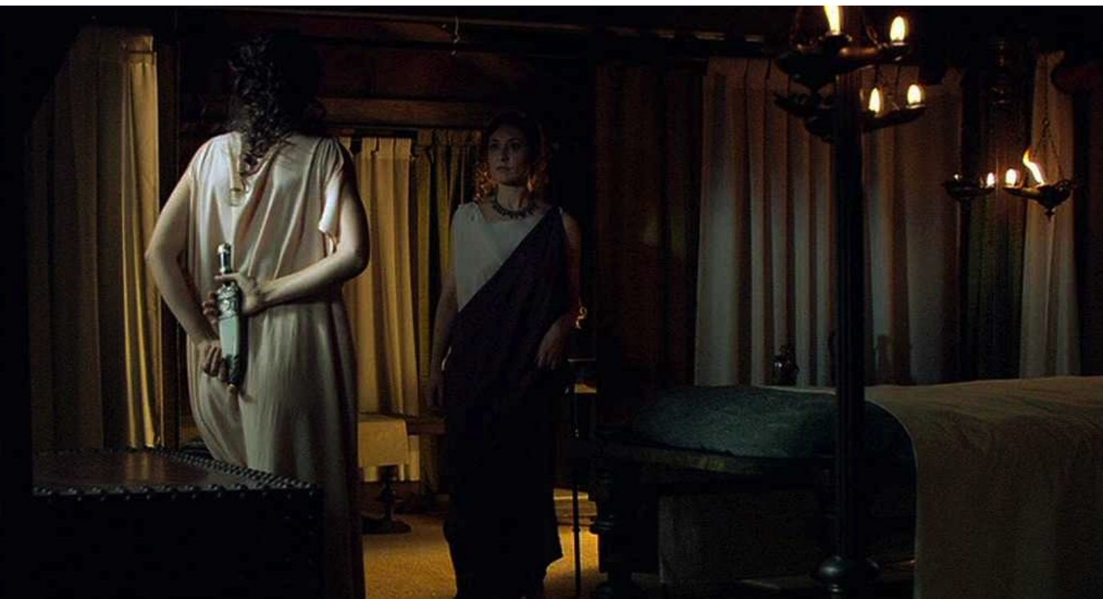
Hispania, la Leyenda : mais, en volant l'arme, celle-ci est surprise par sa maîtresse.