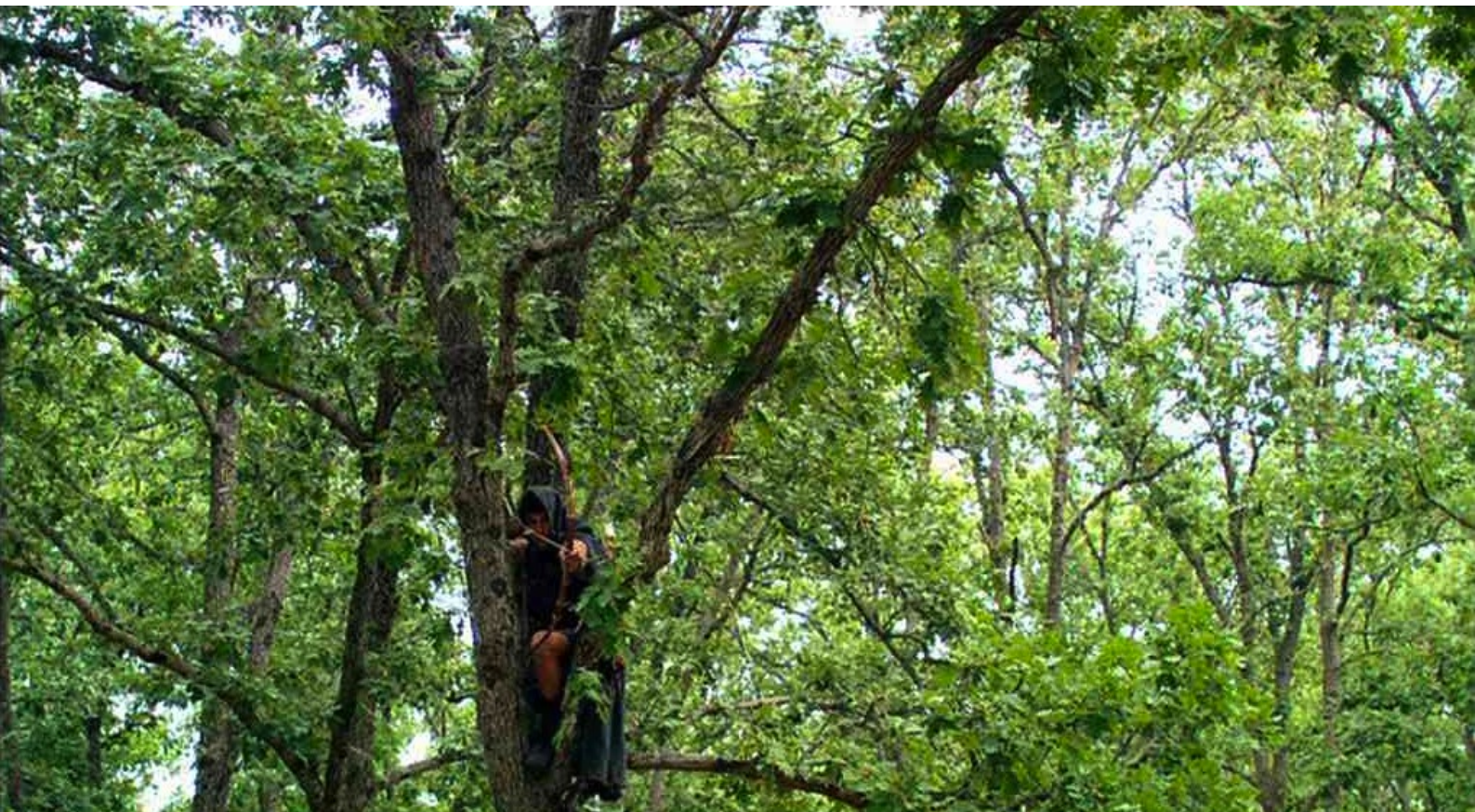
Hispania, la Leyenda : les rebelles, perchés dans les arbres, leur enlèvent la totalité de la somme.