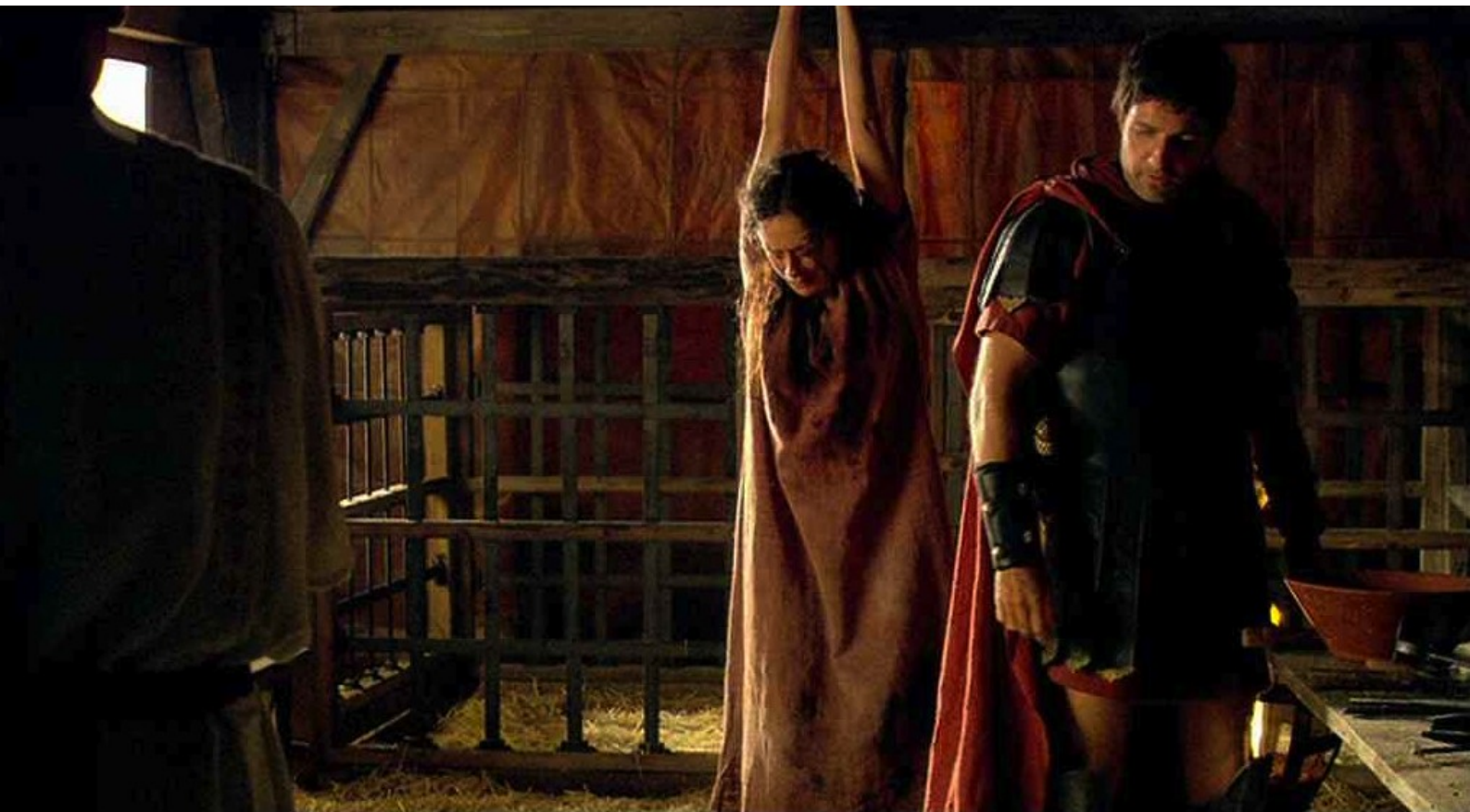
Hispania, la Leyenda : et elle finit par avouer une partie de ce qu'elle sait ;