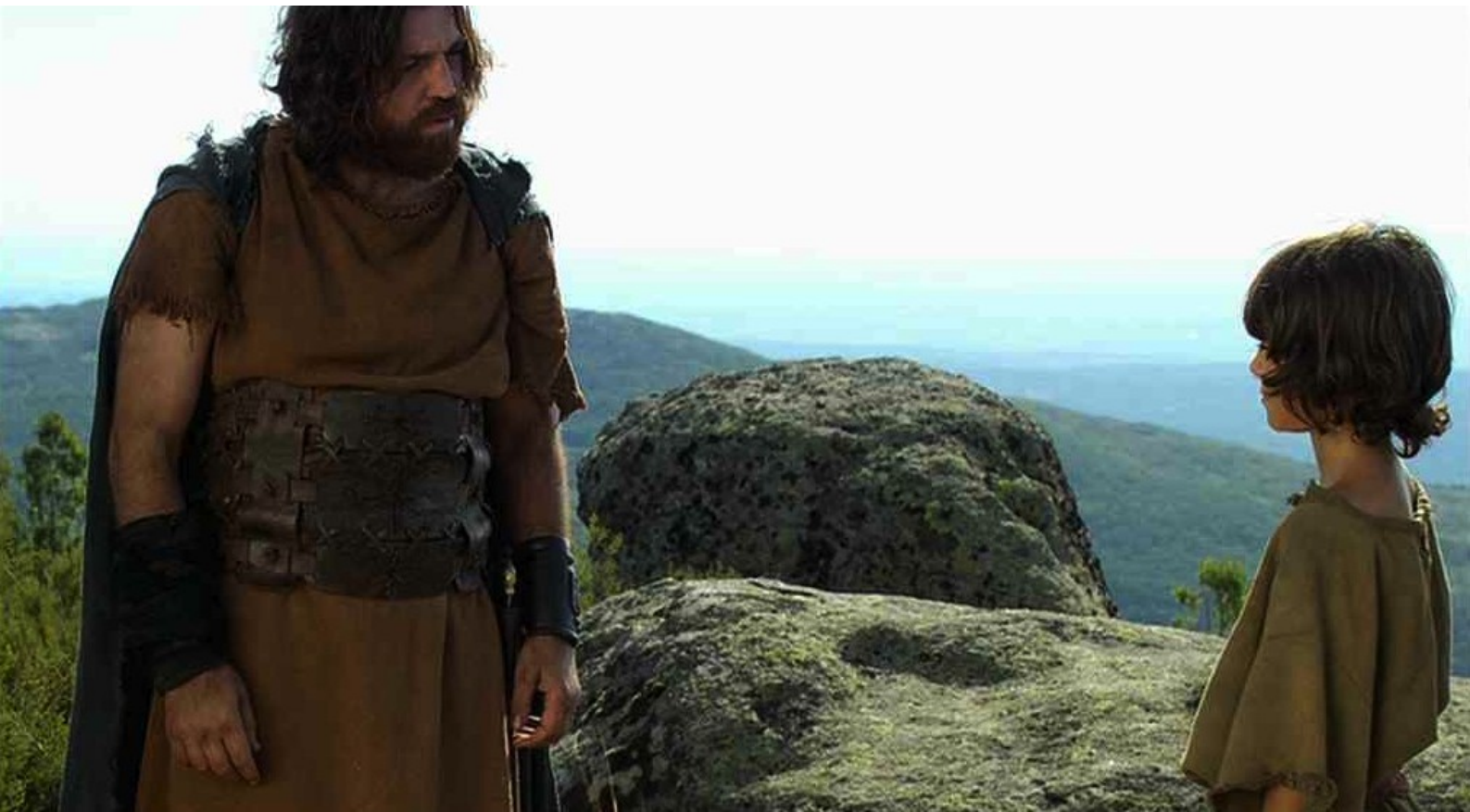
Hispania, la Leyenda : Alors Sandro dit à Tirso qu'il va aller libérer sa mère,