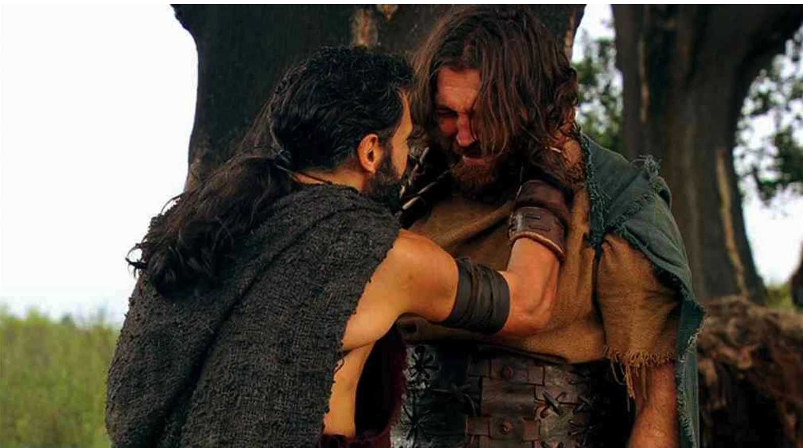
Hispania, la Leyenda : et Viriate réussit à grand-peine à l'en dissuader,