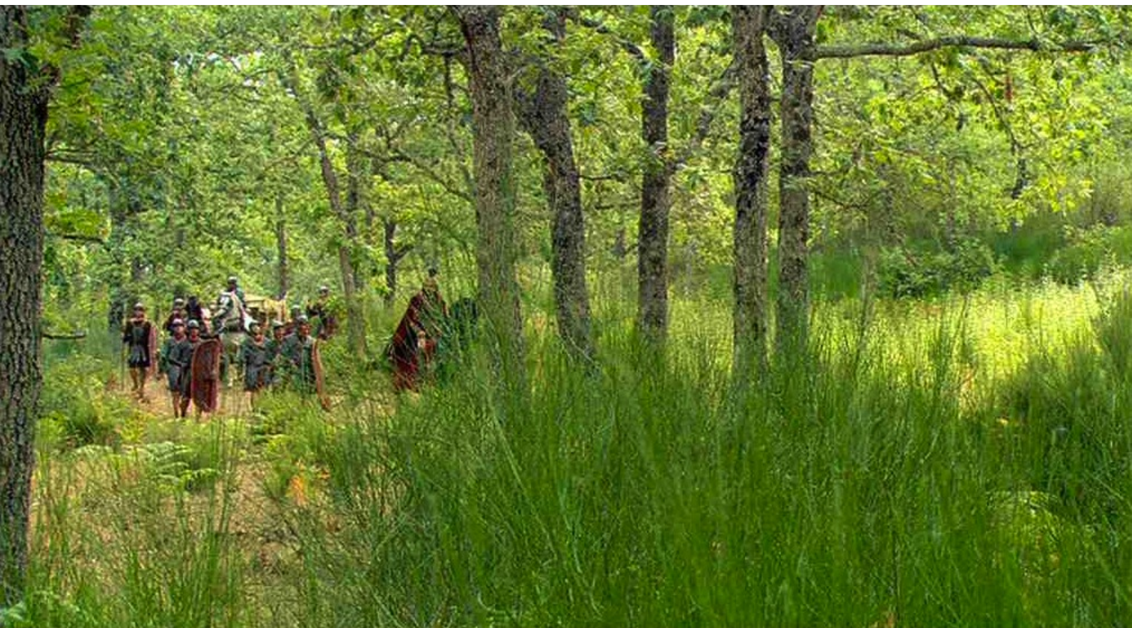
Hispania, la Leyenda : Comme un détachement romain amène l'argent nécessaire pour payer les soldes,