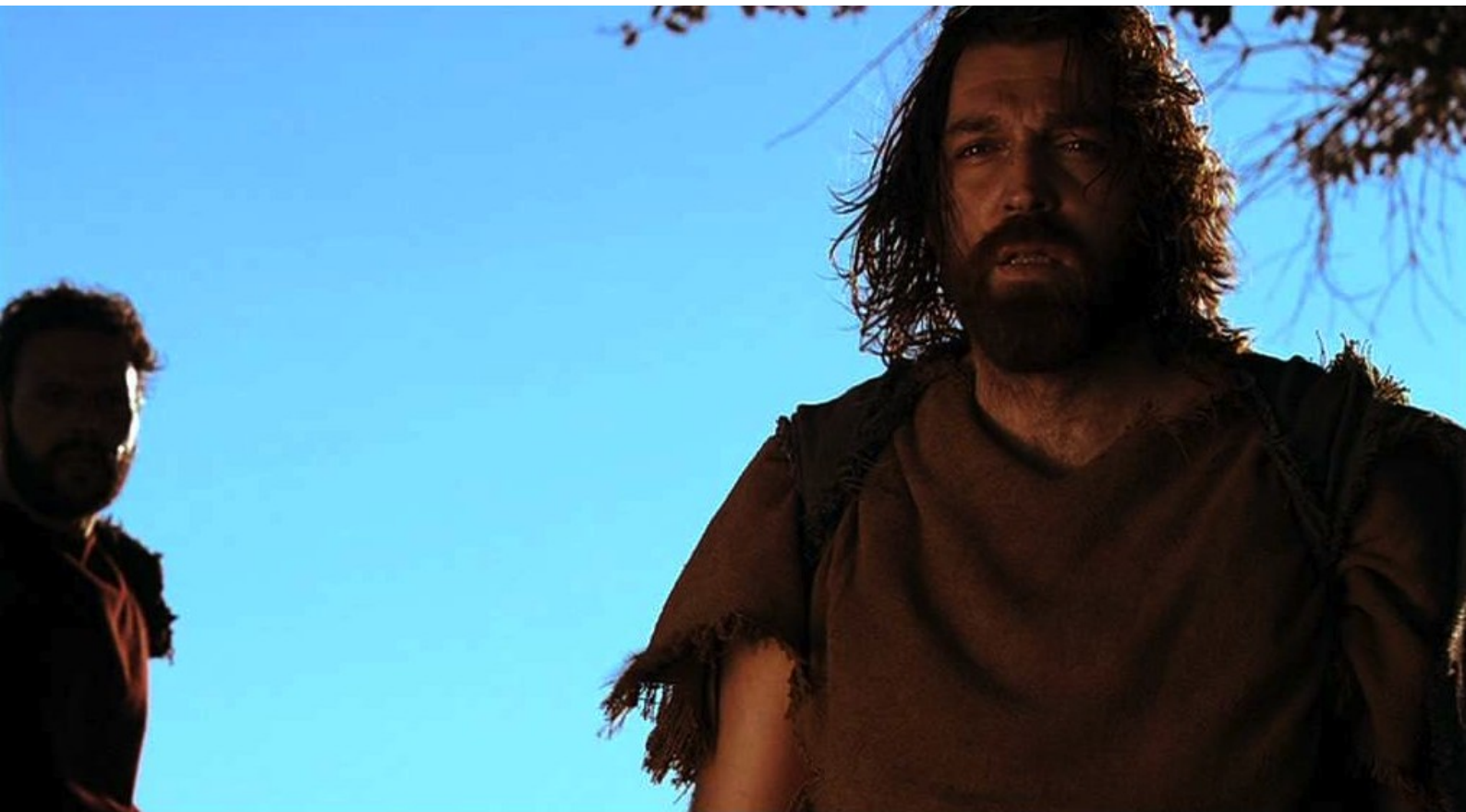
Hispania, la Leyenda : Sandro veut retourner chez les Romains pour venger sa femme,