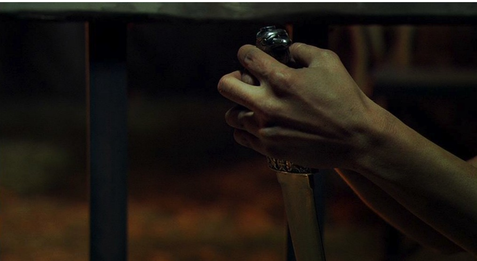
Hispania, la Leyenda : Trop tard : Bárbara s'est poignardée...