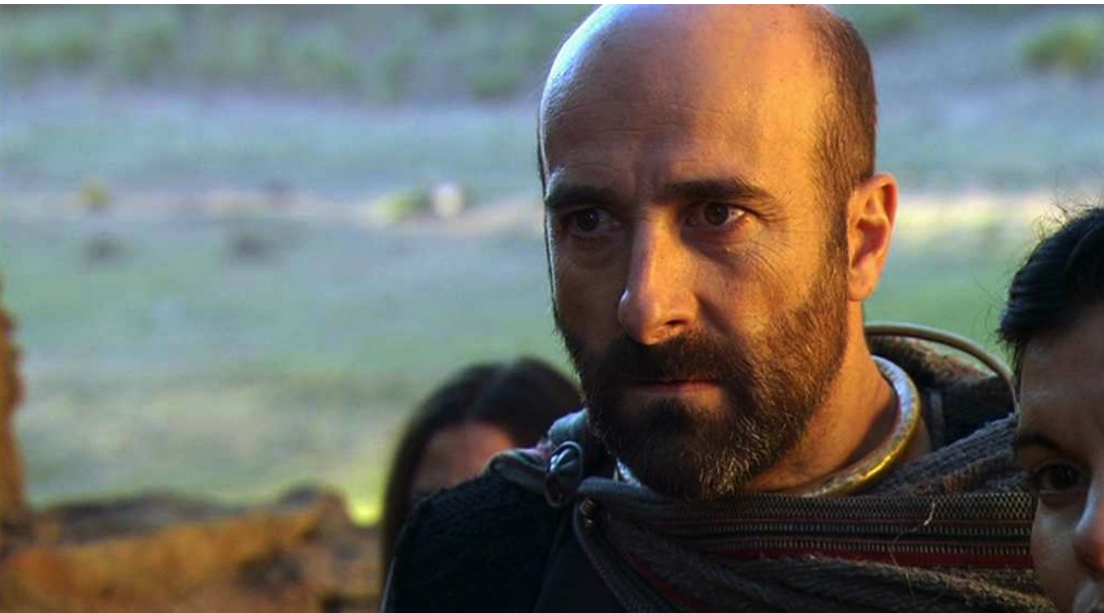
Hispania, la Leyenda : au traître Teodoro,