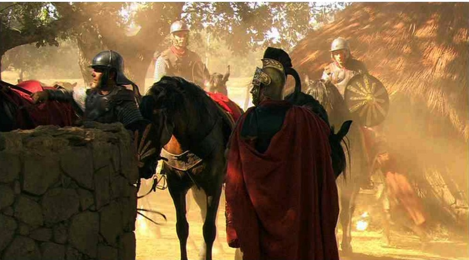
Hispania, la Leyenda : C'est pourquoi, à la tête d'un détachement de soldats,