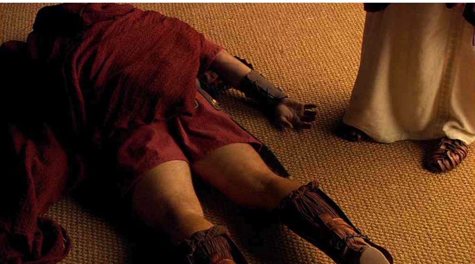
Hispania, la Leyenda : sans pitié pour le cadavre du centurion,