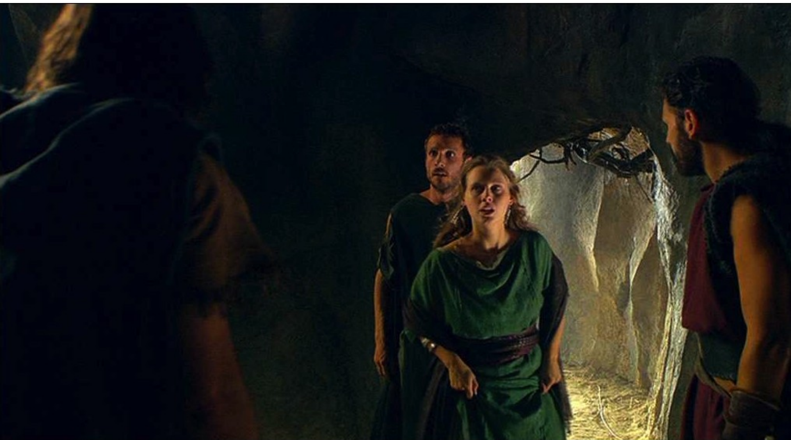
Hispania, la Leyenda : Mais Helena, qui a vu l'enlèvement, accourt au repaire...