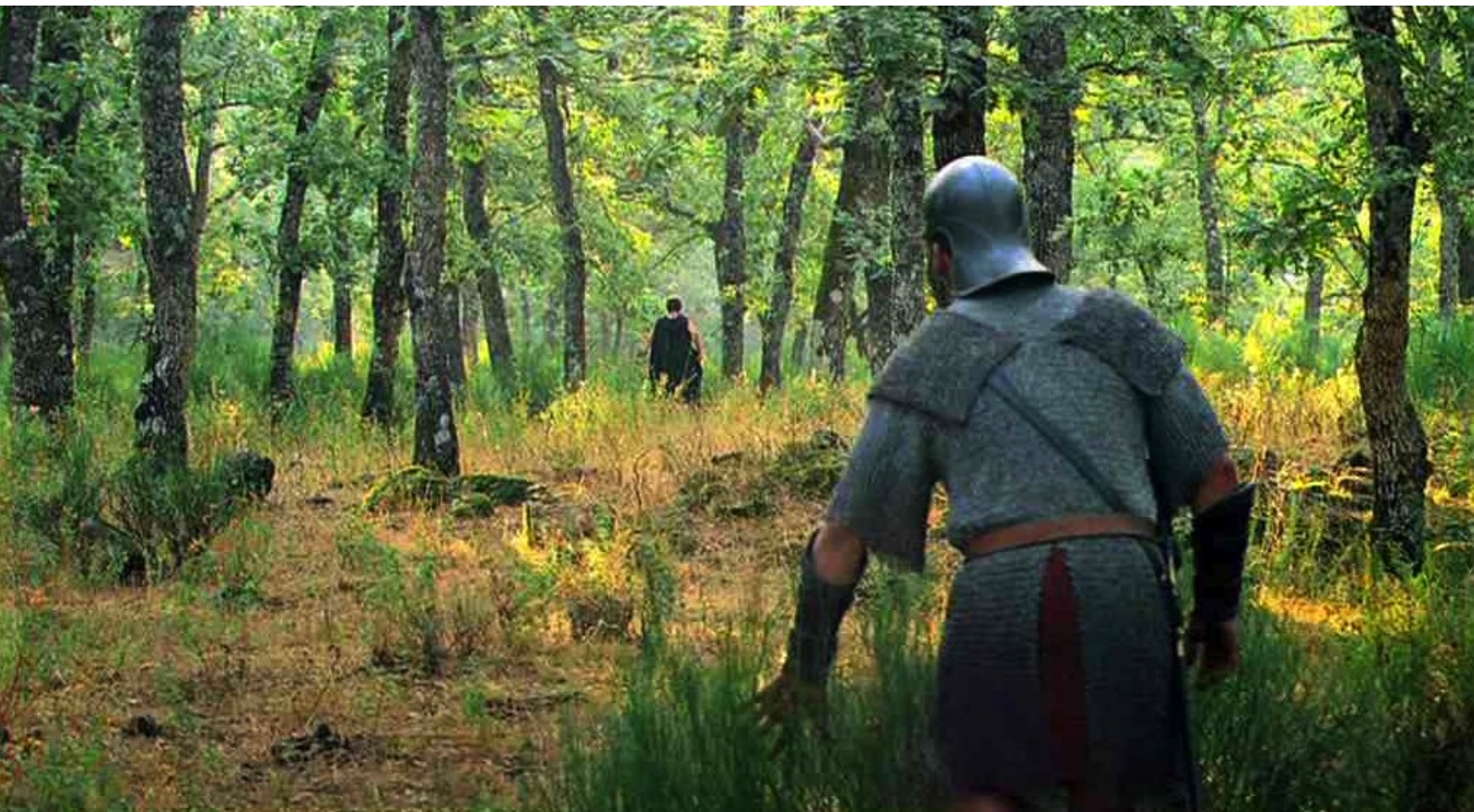
Hispania, la Leyenda : Soupçonnant qu'Hector est un rebelle, Galba le fait suivre dans la forêt,

Comme portfolios du numéro 46 de La 12 e Heure , nous vous offrons plusieurs florilèges de photos tirées des épisodes de la série Hispania, la Leyenda , à laquelle nous avons consacré le dossier du numéro 46 de notre fanzine.