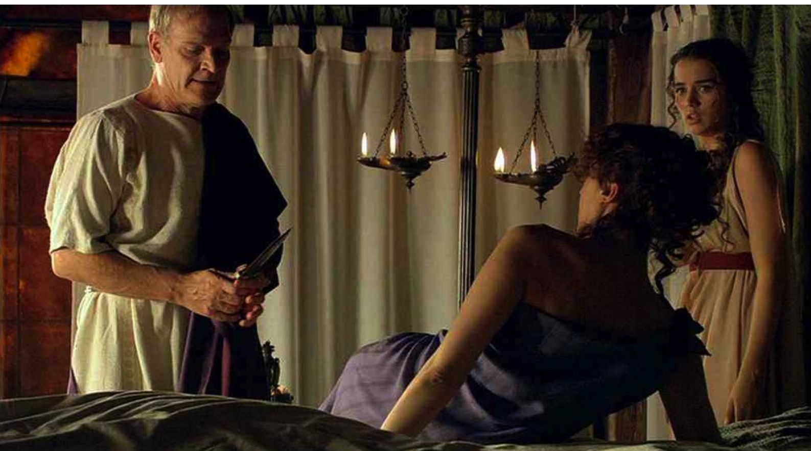
Hispania, la Leyenda : Galba reproche à sa femme d'avoir donné à Bárbara le poignard...