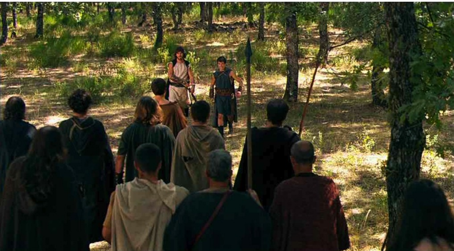
Hispania, la Leyenda : De retour au repaire, les deux amis, réjouis, voient néanmoins arriver...