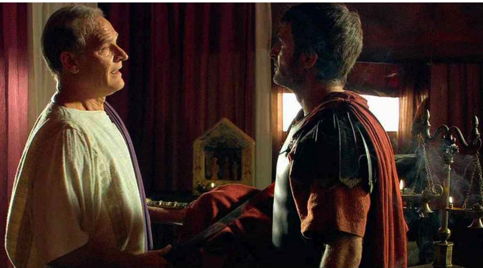
Hispania, la Leyenda : et essuie son glaive...