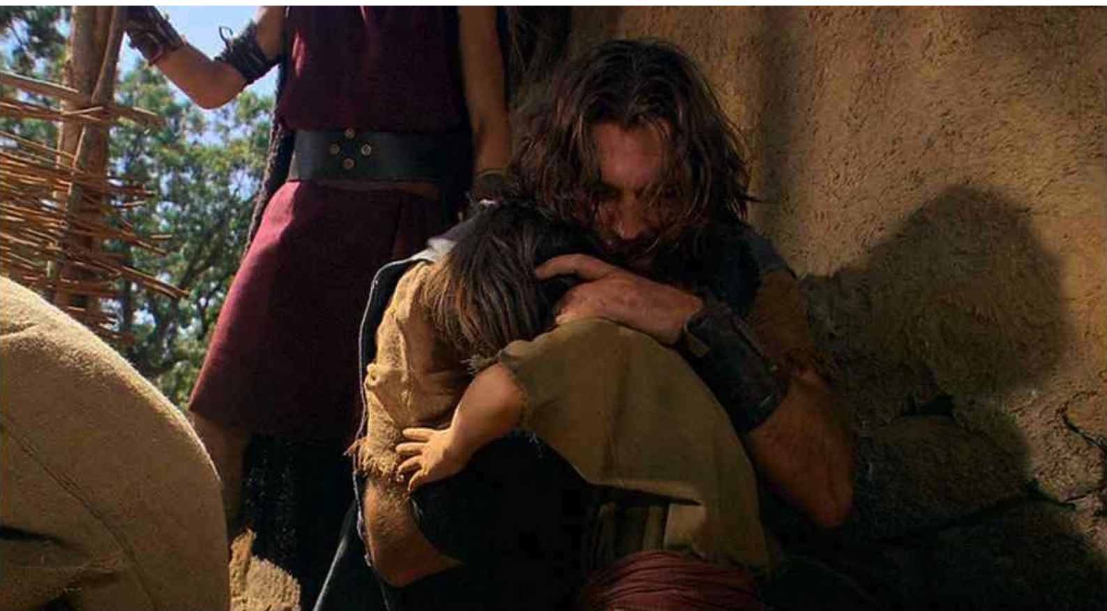
Hispania, la Leyenda : qui se précipite au secours de son fils.