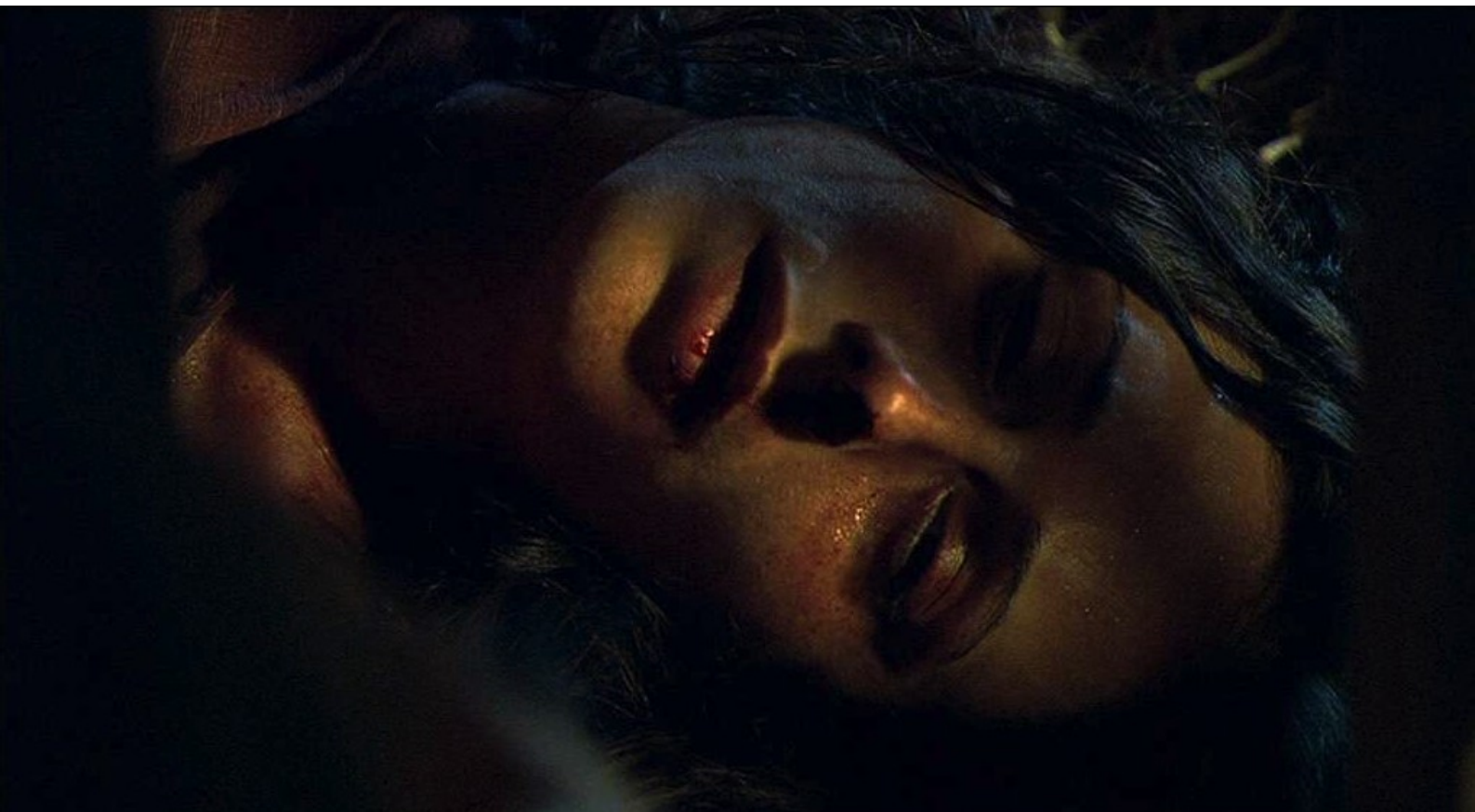
Hispania, la Leyenda : et Sandro et Viriate ne trouvent que son cadavre dans la cage.