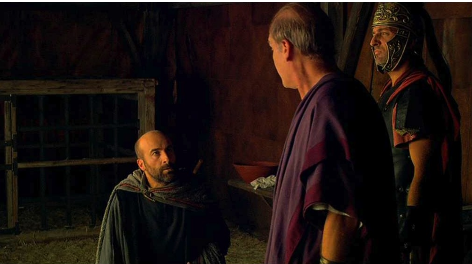
Hispania, la Leyenda : qui s'empresse d'aller tout raconter à Galba.