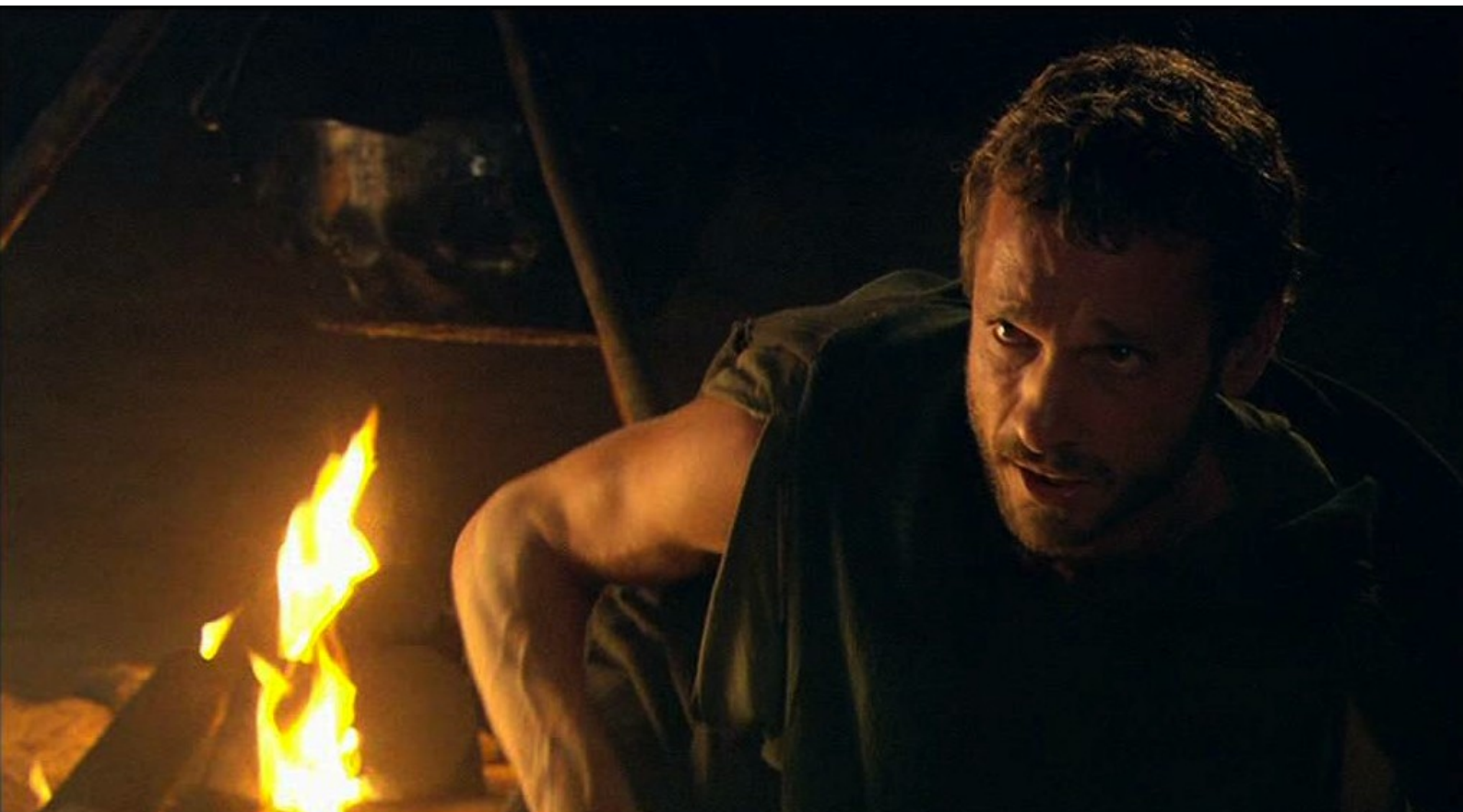
Hispania, la Leyenda : mais, de retour au repaire, il peine à se justifier.