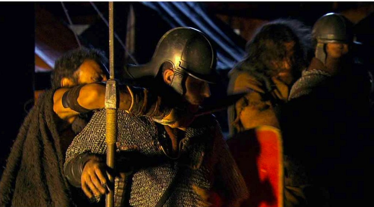
Hispania, la Leyenda : et tuer les sentinelles.