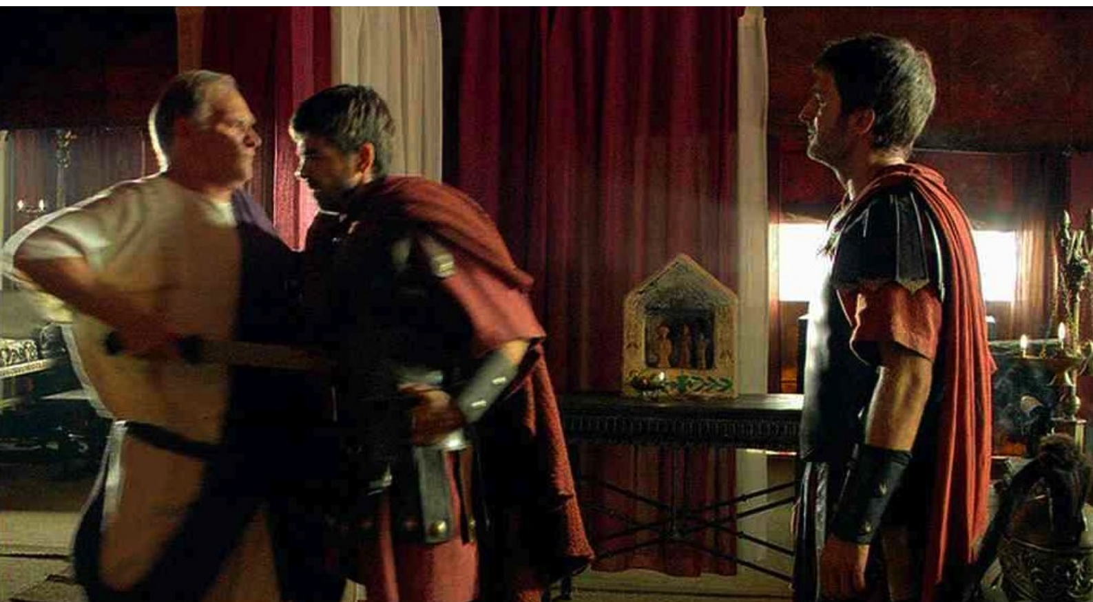
Hispania, la Leyenda : Puis, quand Décimo lui raconte l'embuscade, Galba le tue...