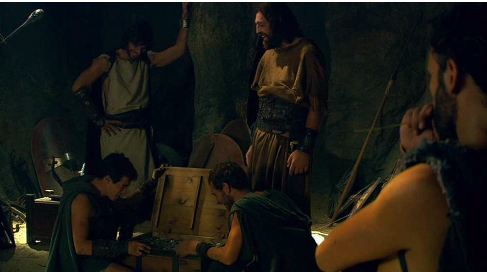
Hispania, la Leyenda : tandis que les insurgés contemplent leur butin dans leur repaire.