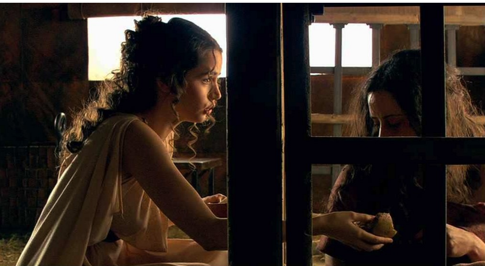
Hispania, la Leyenda : pour apporter du pain à la prisonnière,