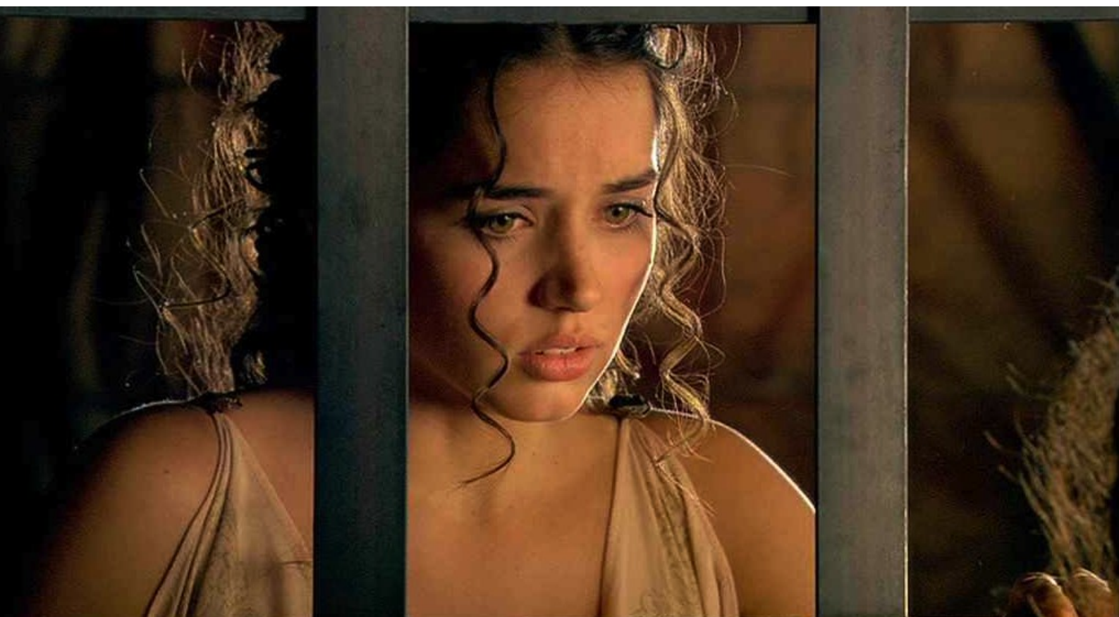
Hispania, la Leyenda : au grand effroi de la jeune esclave ;