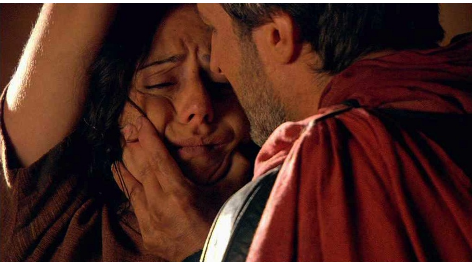
Hispania, la Leyenda : et l'interroge brutalement,