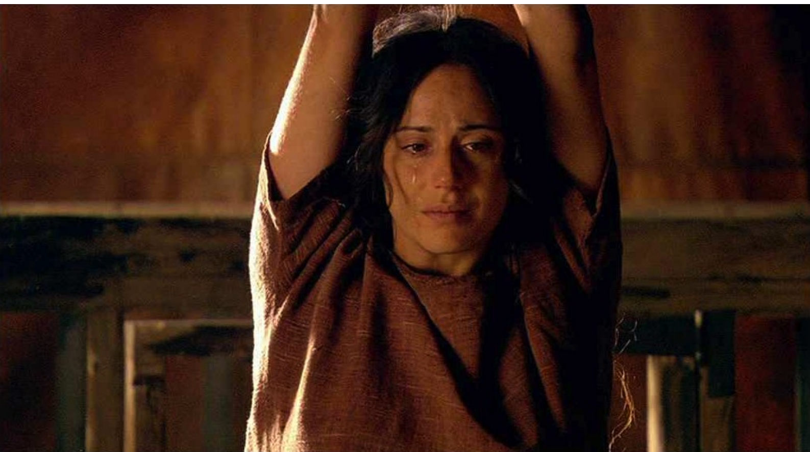
Hispania, la Leyenda : et, alors qu'elle pleure,