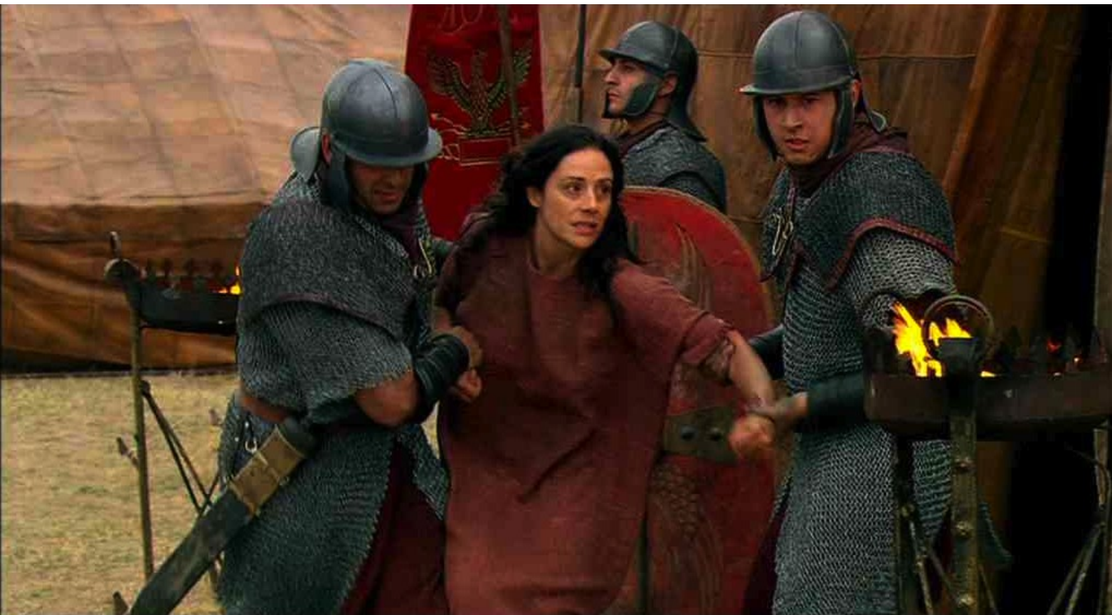
Hispania, la Leyenda : et la fait traîner au camp romain,