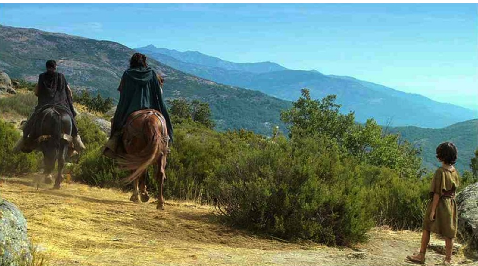
Hispania, la Leyenda : et il part, accompagné par Viriate.