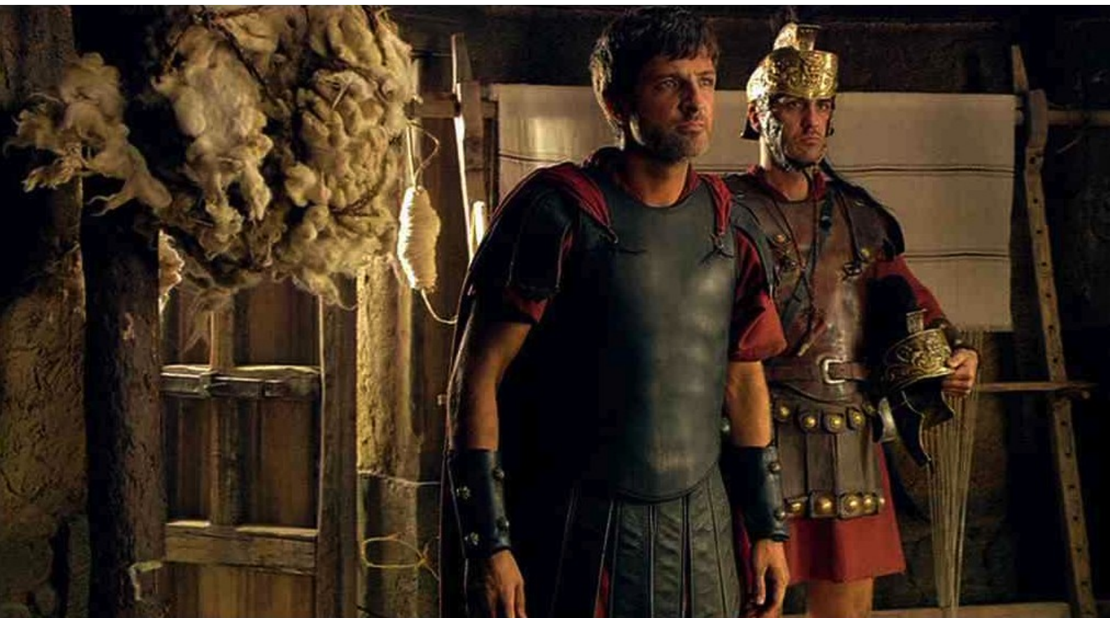
Hispania, la Leyenda : Marco entre chez Bárbara,