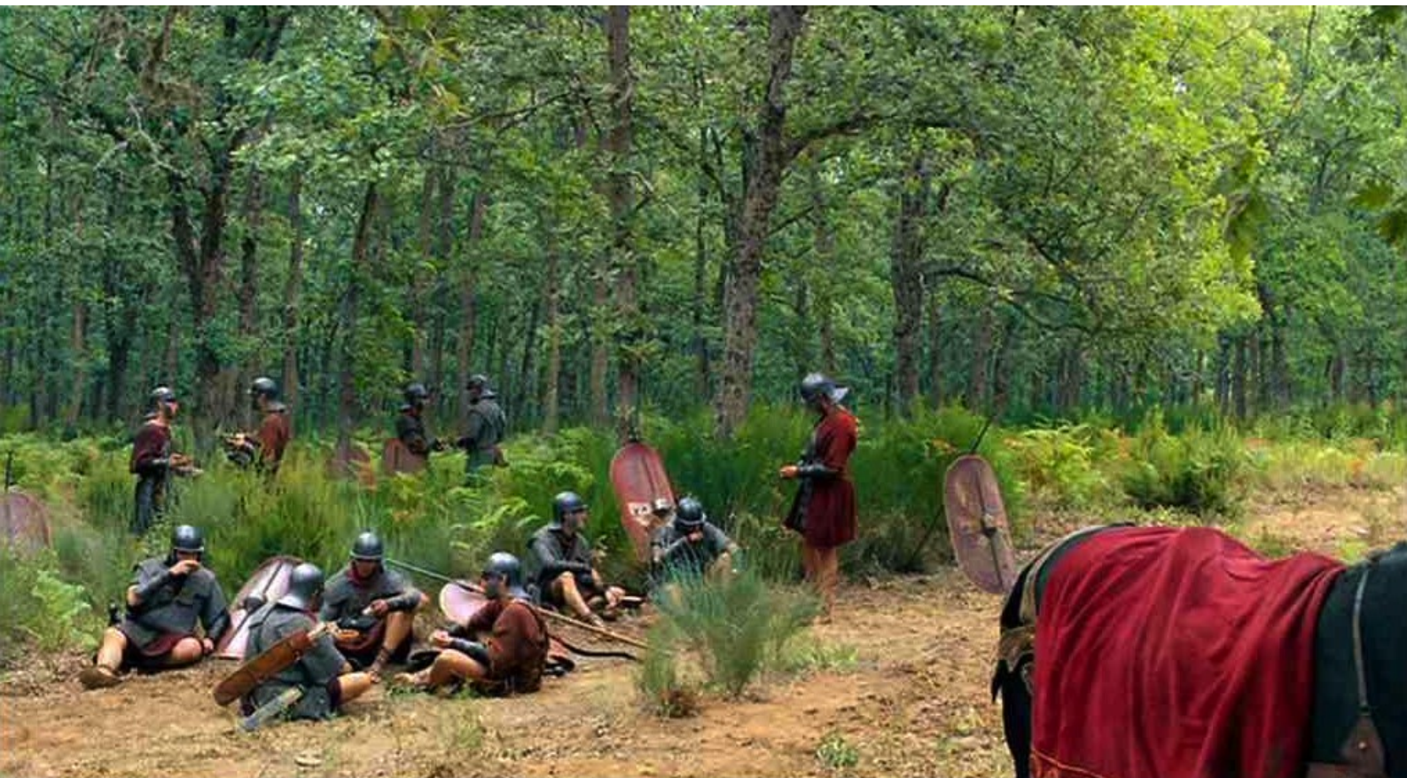
Hispania, la Leyenda : lors d'une pause des convoyeurs...