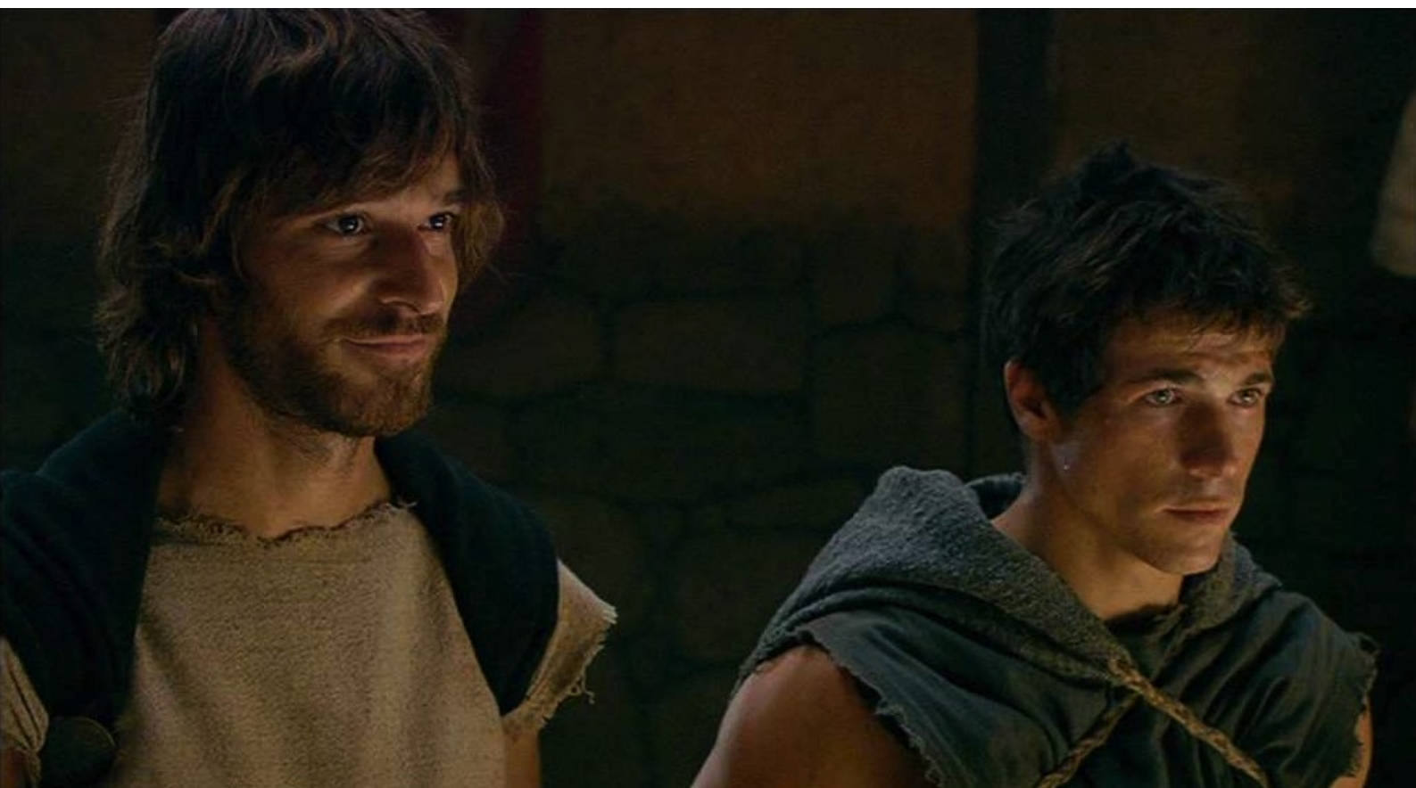
Hispania, la Leyenda : ils sont reçus au Conseil d'un premier village,