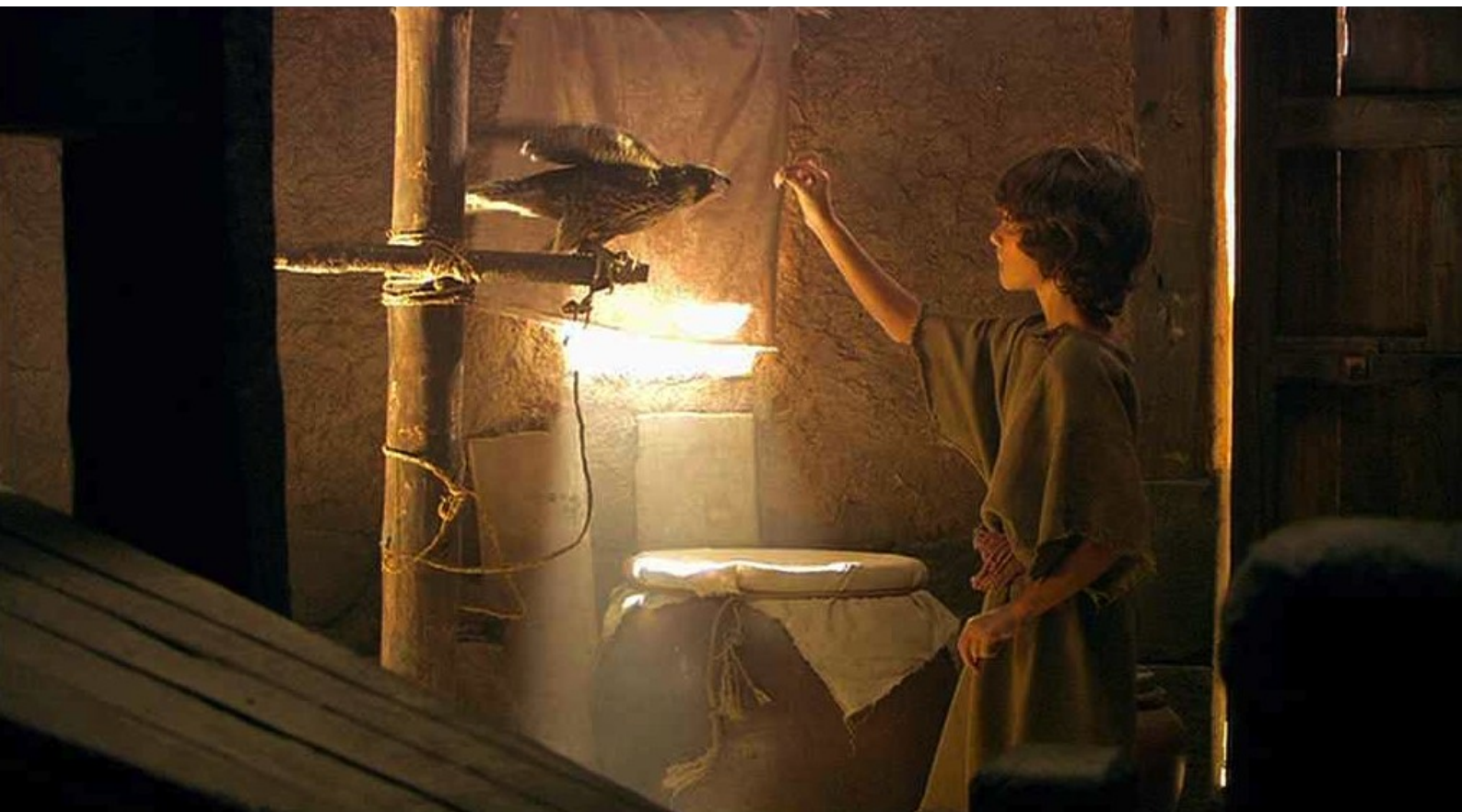
Hispania, la Leyenda : a involontairement révélé que sa mère collabore avec les insurgés...