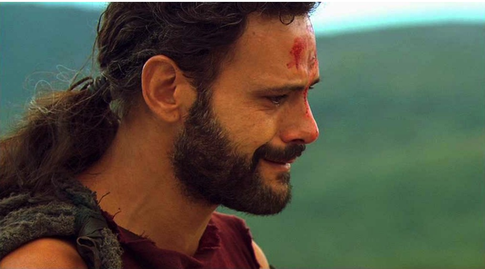
Hispania, la Leyenda : non sans pleurer, lui aussi, la mort de sa sœur.