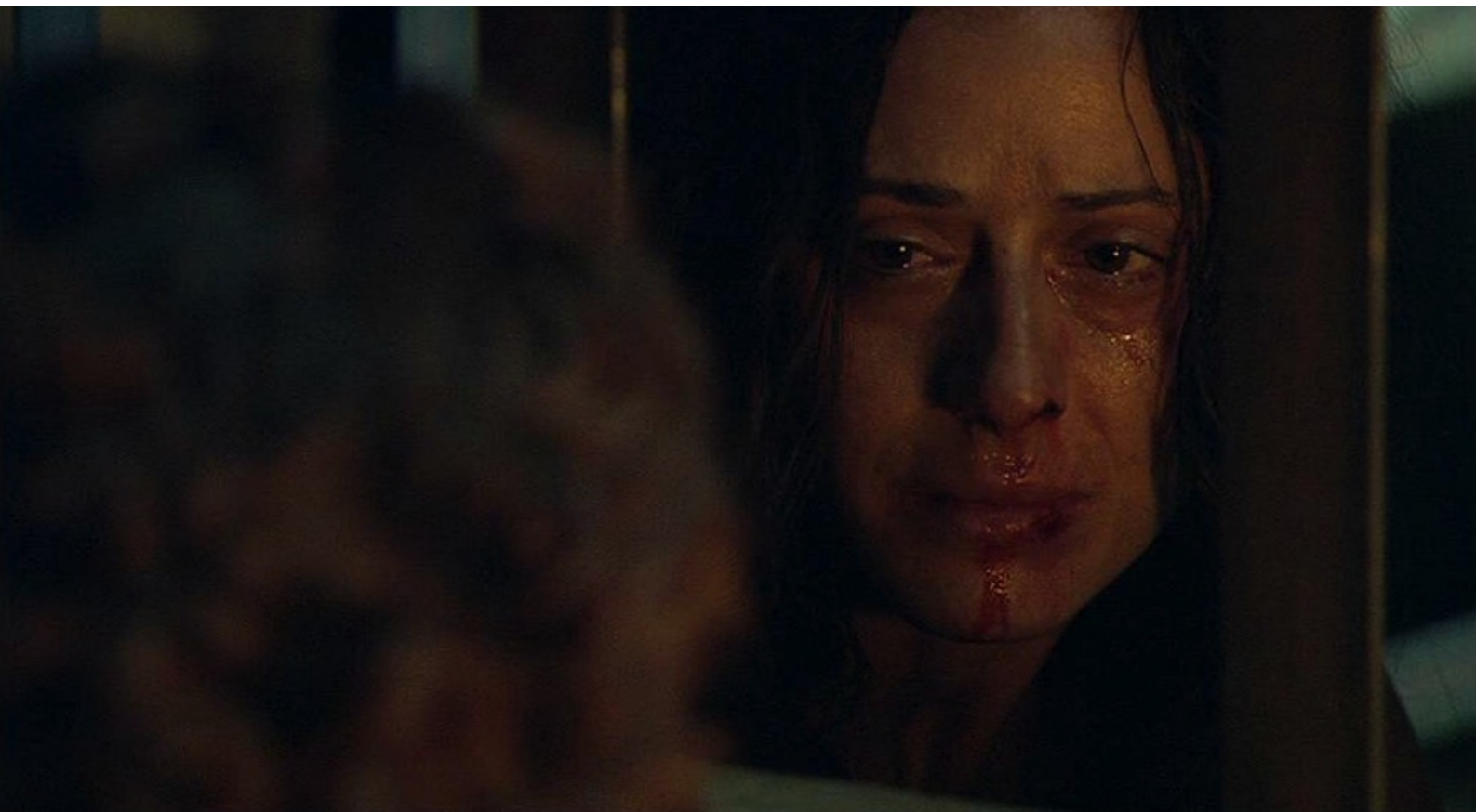
Hispania, la Leyenda : qui lui demande un poignard pour se suicider,