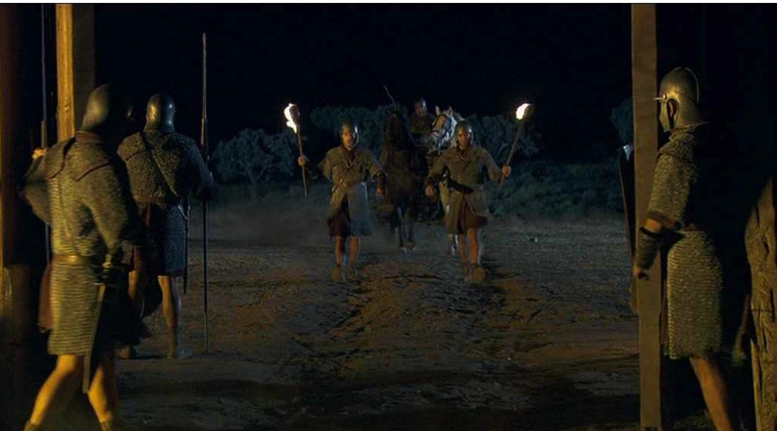
Hispania, la Leyenda : Ils rendent aux Romains les soldes volées, mais se cachent sous le char...