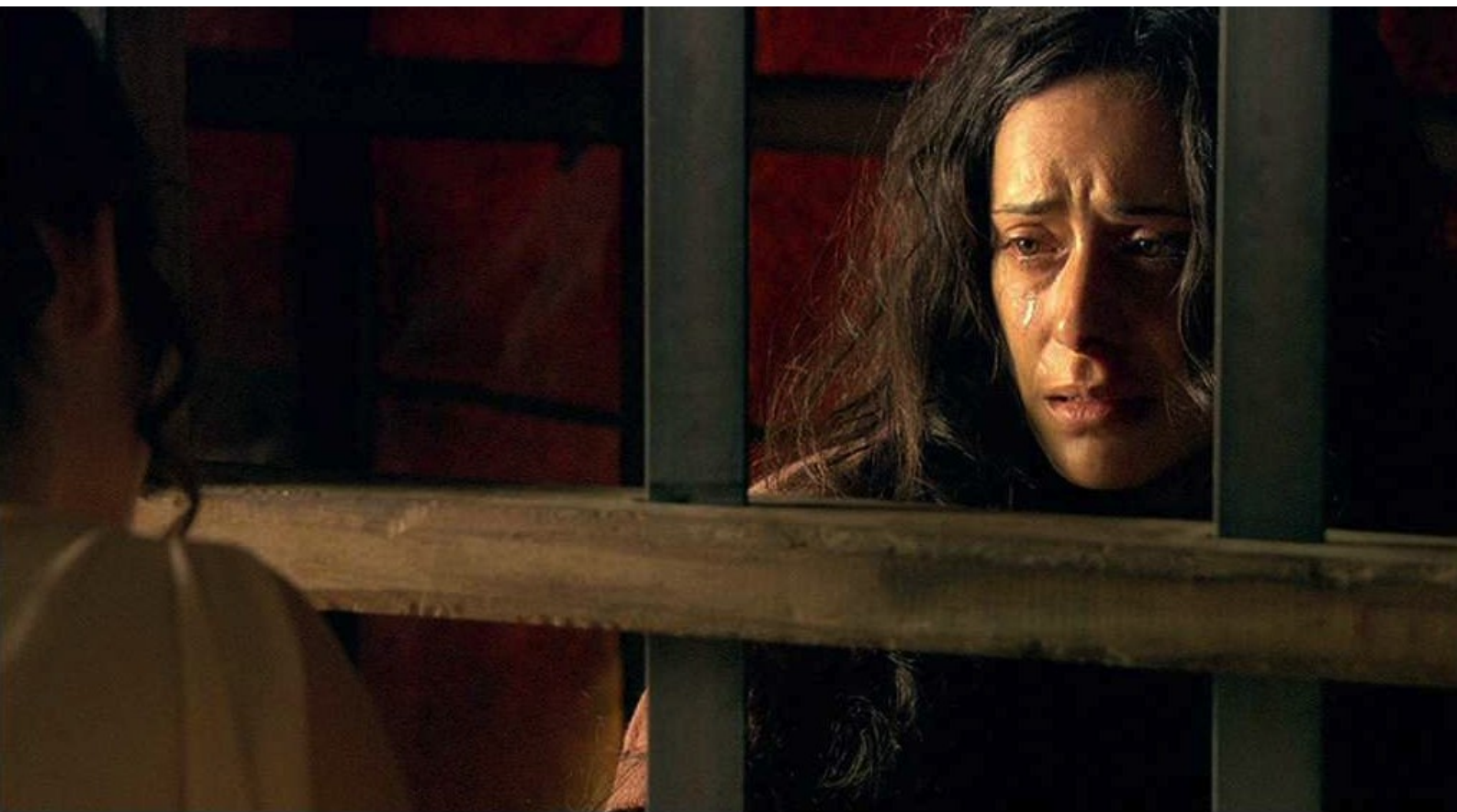
Hispania, la Leyenda : puis elle est enfermée dans une cage.