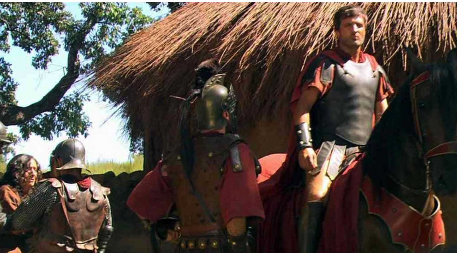
Hispania, la Leyenda : l'emmène de Caura...