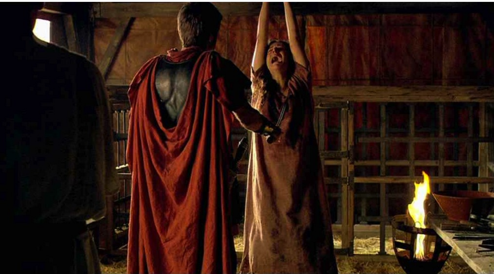
Hispania, la Leyenda : il la pique...