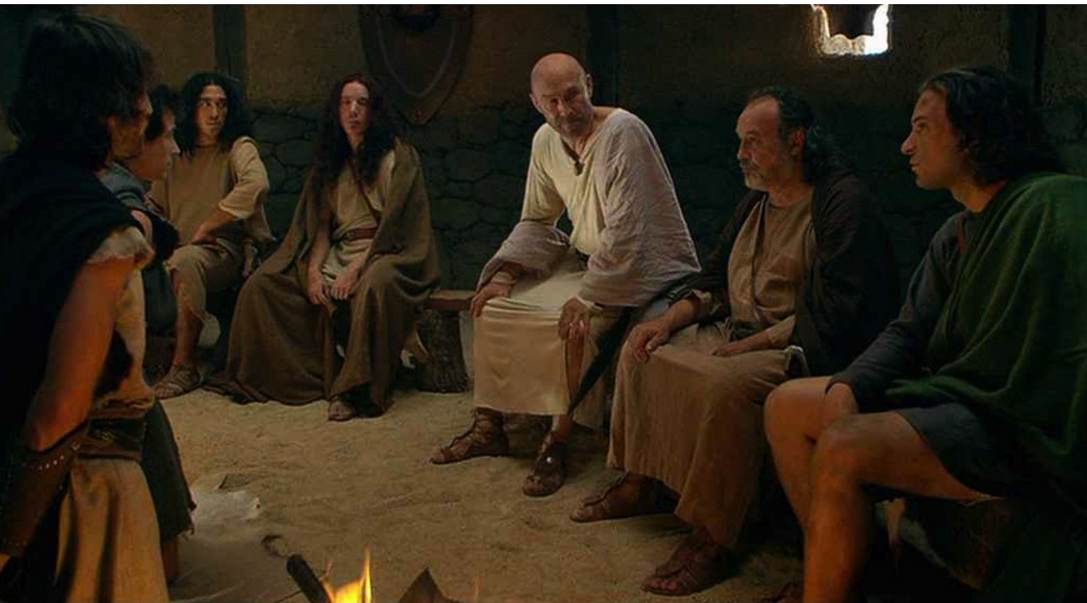
Hispania, la Leyenda : mais le chef, timoré, refuse d'affronter les Romains.