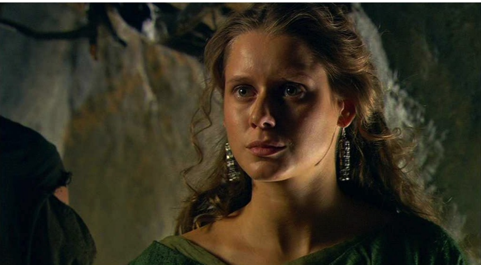
Hispania, la Leyenda : raconte tout à Viriate et à Sandro,