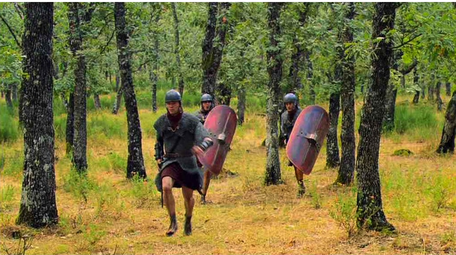
Hispania, la Leyenda : et les légionnaires perdent sa trace ;