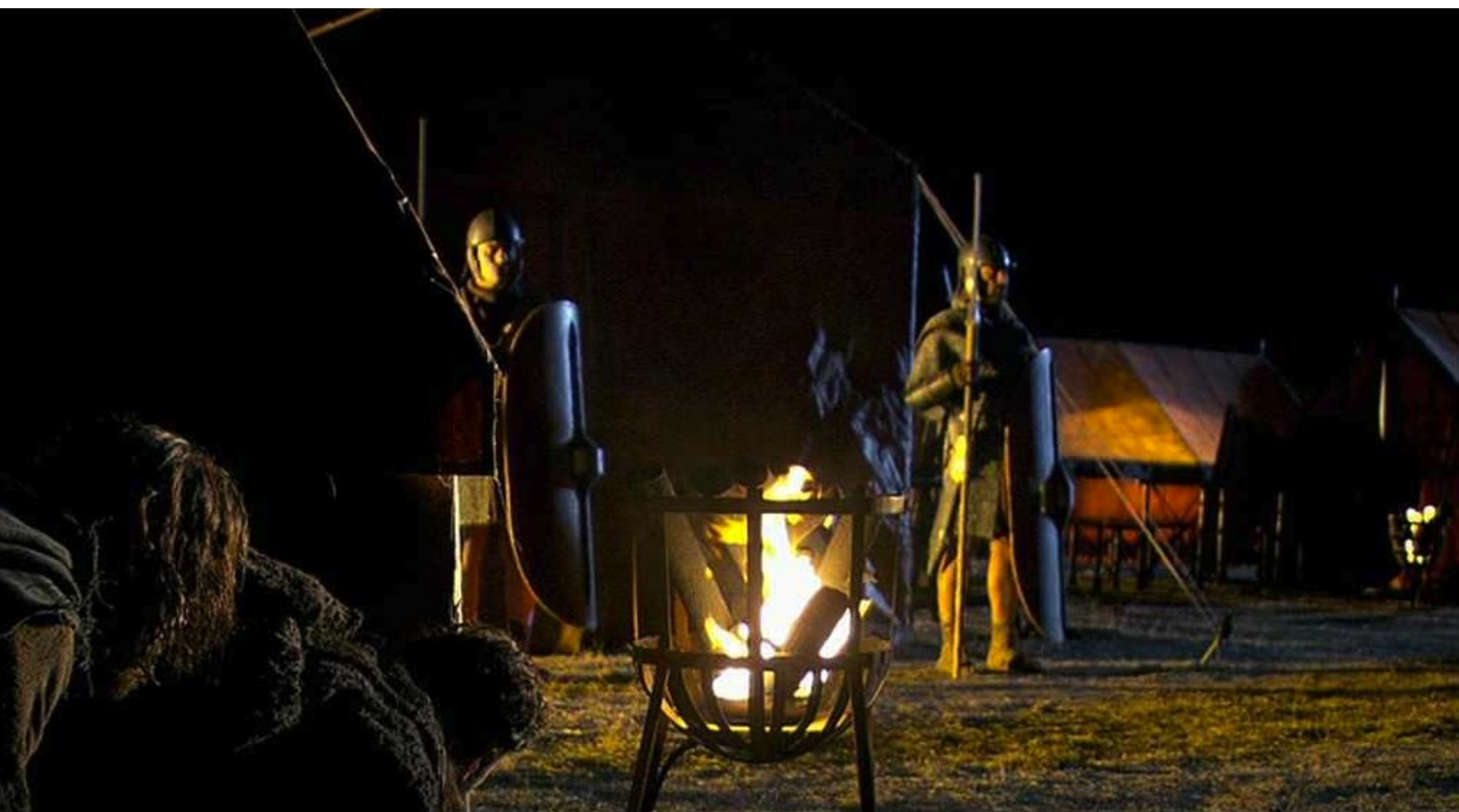
Hispania, la Leyenda : pour pénétrer dans le camp...