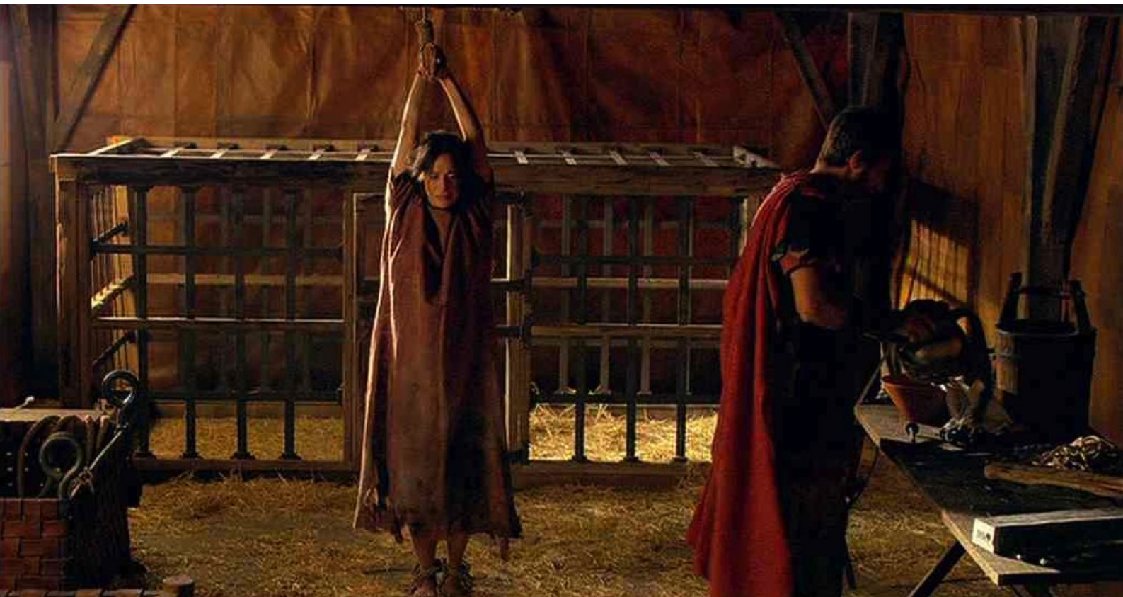
Hispania, la Leyenda : Puis Marco se prépare à la torturer,