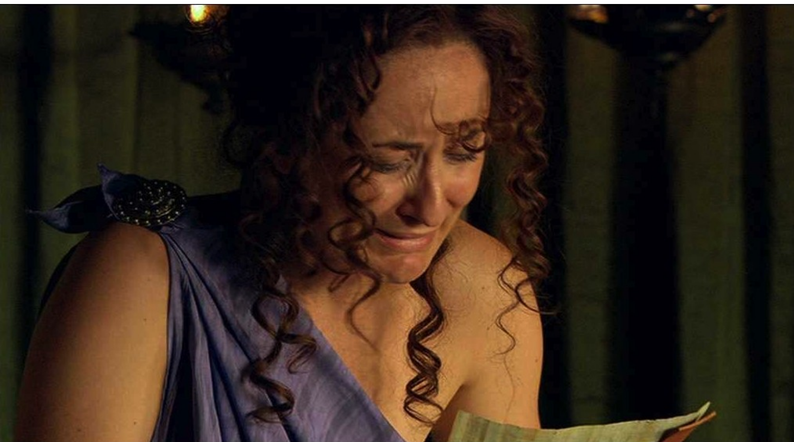
Hispania, la Leyenda : et lui remet une lettre venant de Rome,