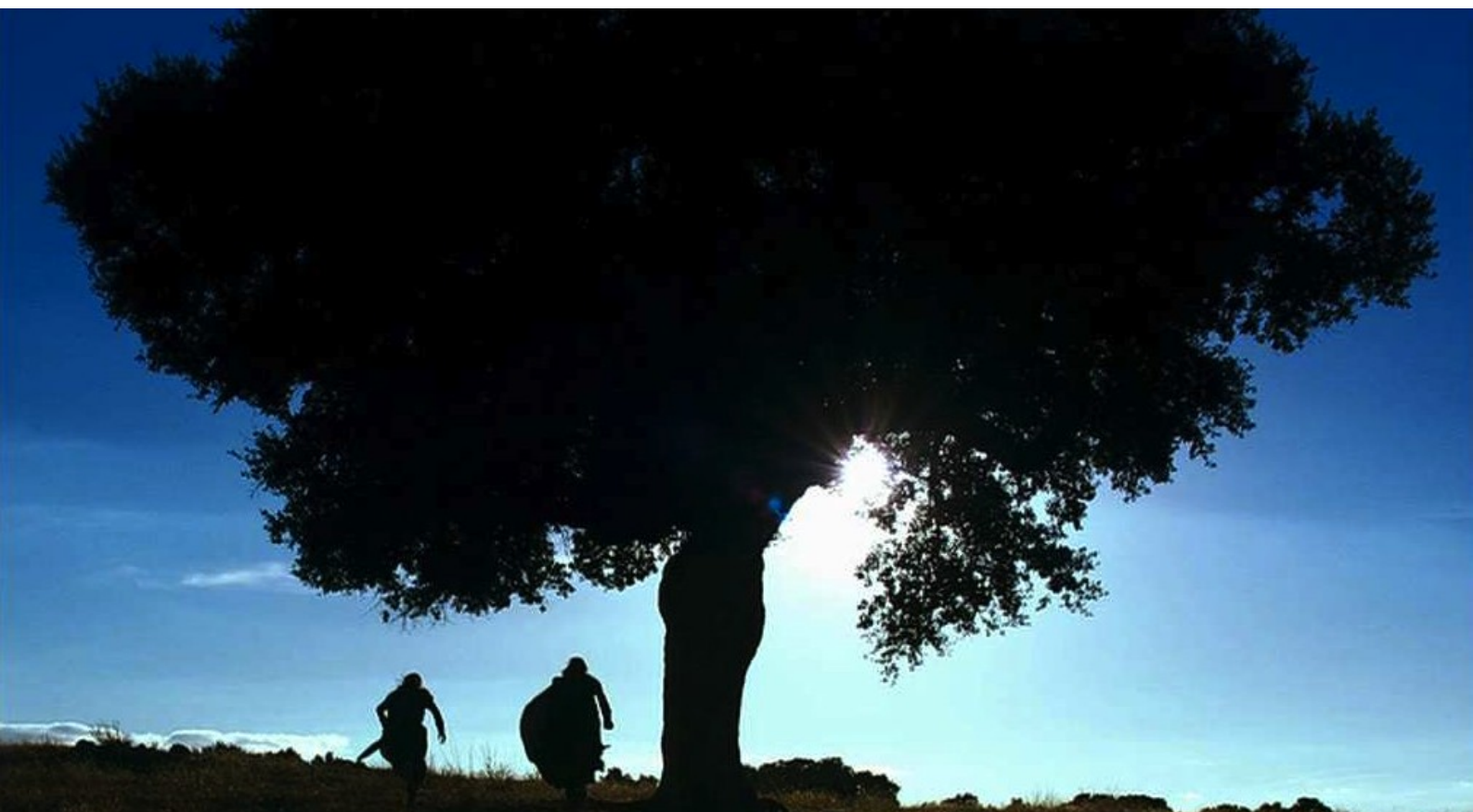
Hispania, la Leyenda : S'enfuyant du camp à l'aube, ils sont désespérés :